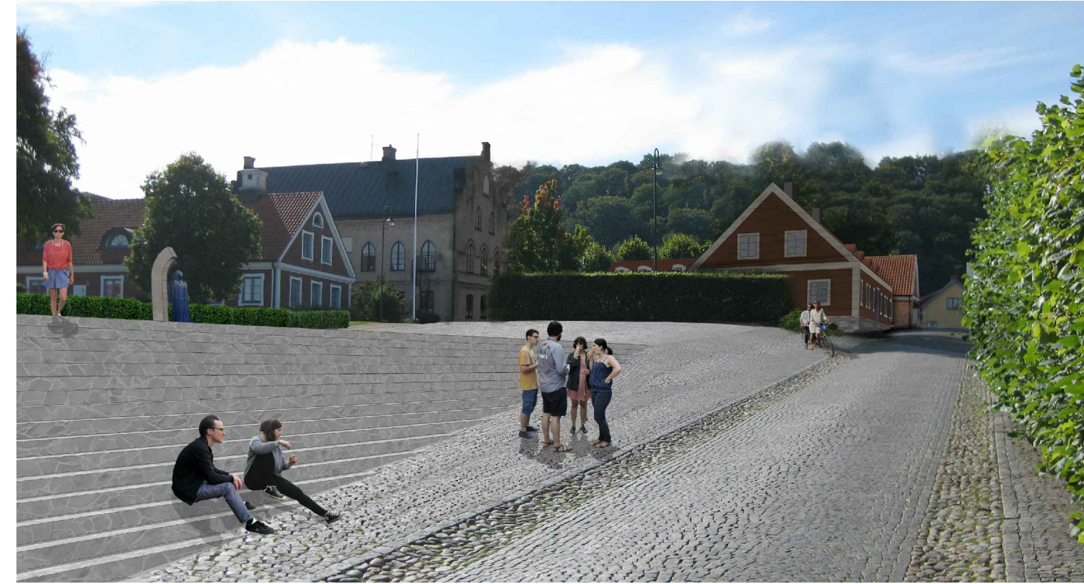
3 Kyrkogatan mot sydväst