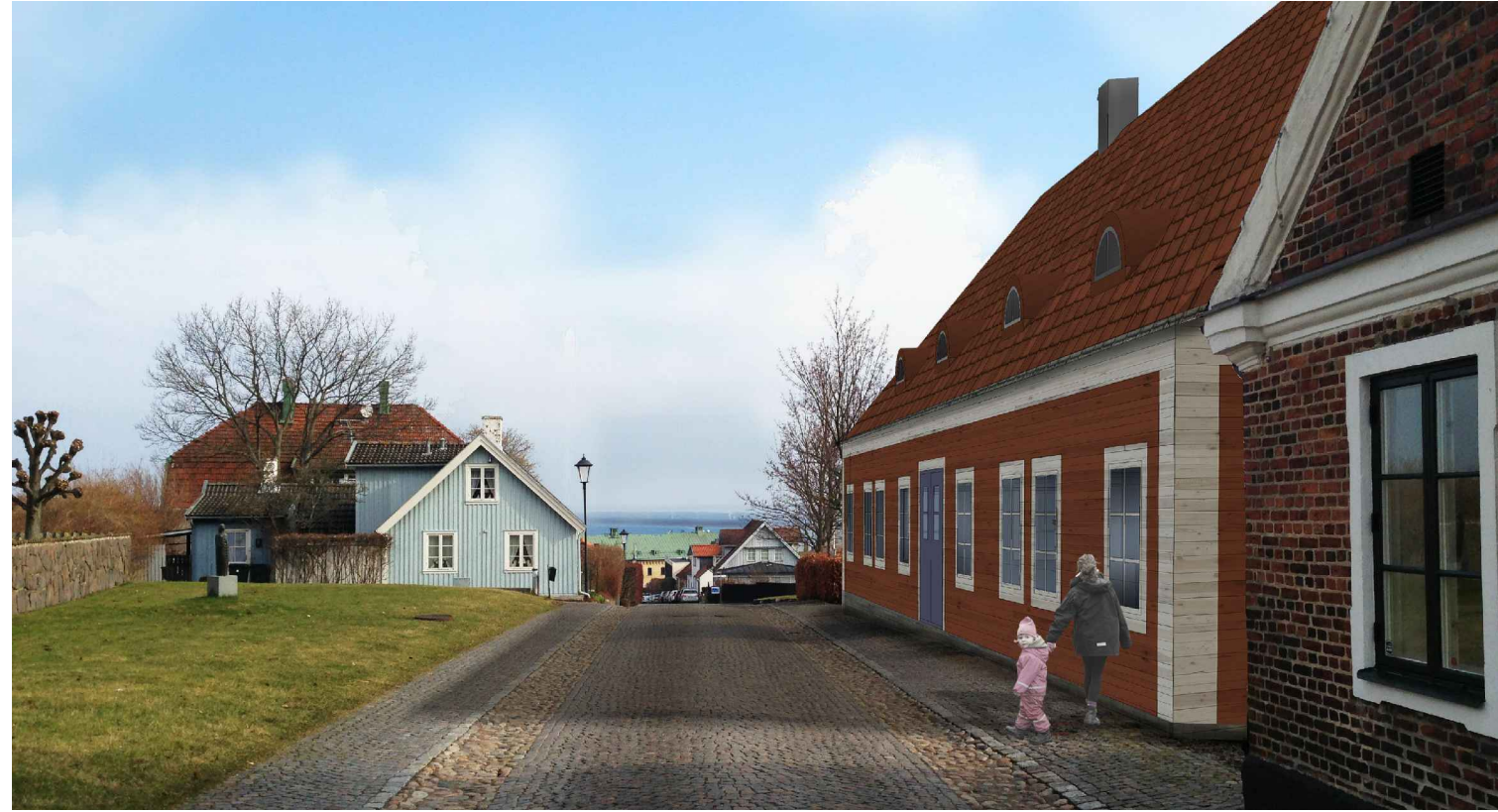
1 Kyrkogatan mot nordost