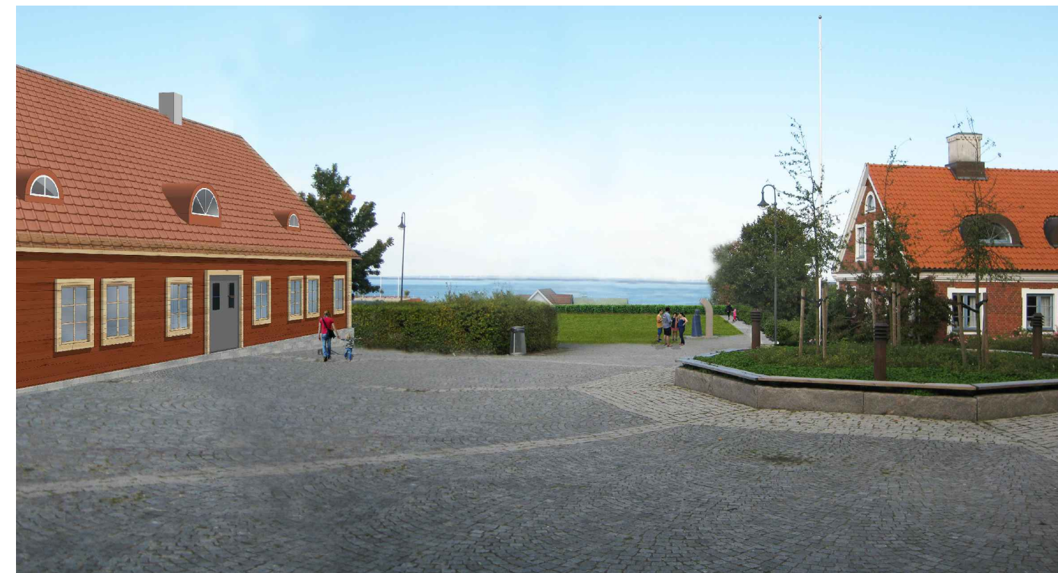
4 Dalmanska tomten